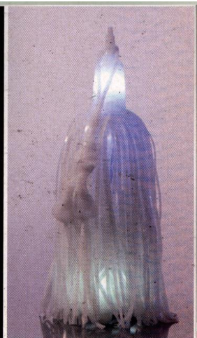
"בדרך כלל אהיל משמש כיריעה שבאה להצל את מקור האור ולעמעם אותו, ואילו כאן הוא משמש כגוף המפיק בעצמו את האור"